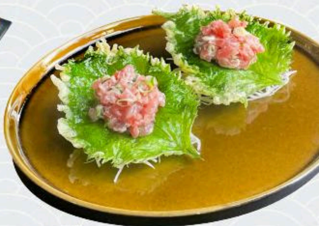
Tempurá de shiso A tum/salmão R$30,00