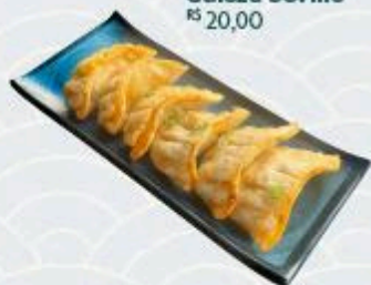
Guioza bovino R$ 20,00