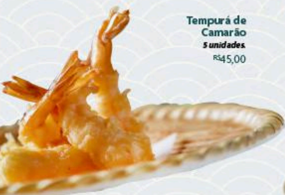
Tempurá de Camarão 5 unidades R$45,00